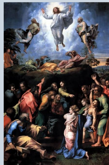
transfiguratie, Rafaël, 1517