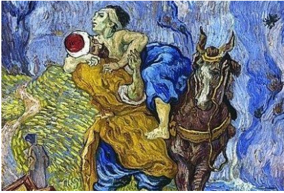
De barmhartige Samaritaan (naar Delacroix), vincent van Gogh, mei 1890